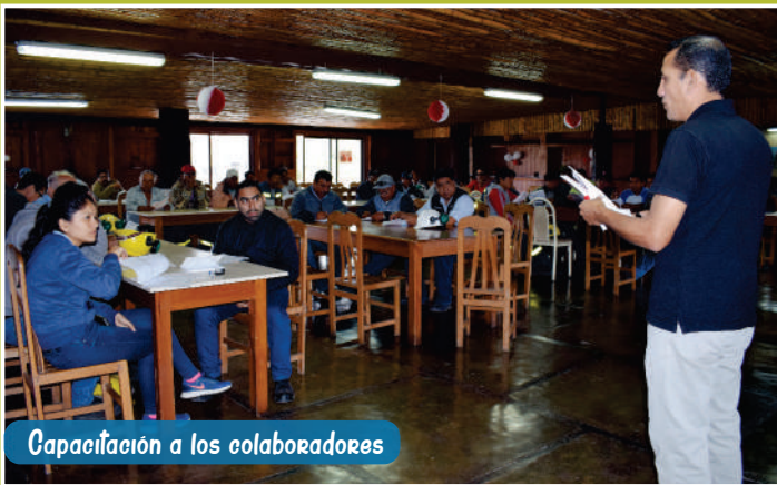
Capacitación a los colaboradores

Colaborando activamente con los Censos Nacionales 2017, nuestros trabajadores participaron del curso de capacitación dictado por el Instituto Nacional de Estadística e Informática - INEI para el desarrollo del empadronamiento especial.