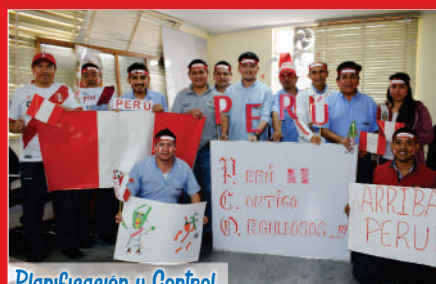
Planificación y Control