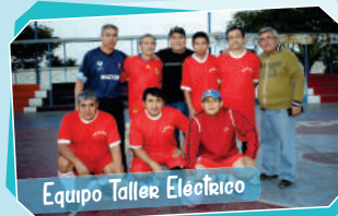
Equipo Taller Eléctrico