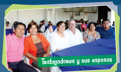
Trabajadores y sus esposas