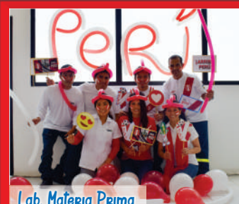
Lab. Materia Prima