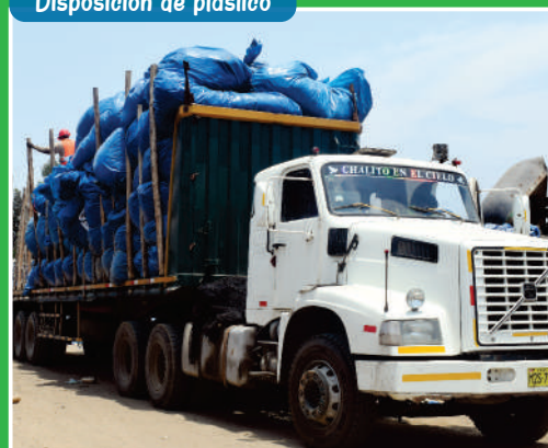
Disposición de plástico

Asimismo, de acuerdo a las normas vigentes, los residuos permanecen en el interior de la empresa hasta su disposición final, evitando contaminar el medio ambiente.