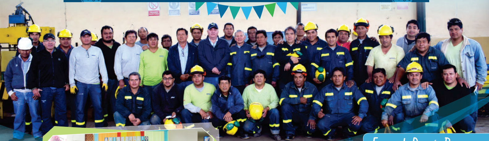
Equipo de División Pozos

Un ambiente de unión y confraternidad vivieron nuestros colaboradores de la División Pozos durante la celebración de su V aniversario. Los trabajadores, acompañados de sus familias, participaron de una amena mañana, que culminó con un delicioso almuerzo.