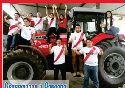
Operaciones y Cosecha