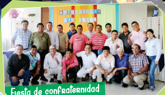
Fiesta de confraternidad

De este modo, nuestros electricistas, mecánicos, soldadores, perforadores y motoristas de planta celebraron ser parte de este equipo, el cual contribuye cada día con el desarrollo de nuestra familia azucarera.