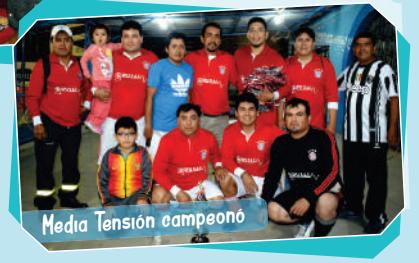
Media Tensión campeón