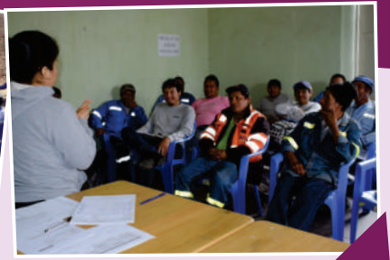
Dinámicas con los colaboradores de anexos