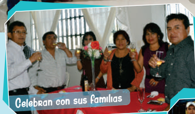
Celebran con sus familias